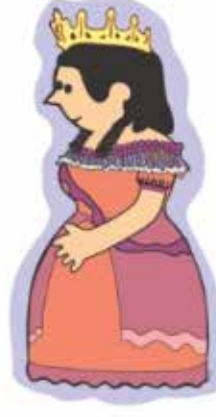
Carlota de Bélgica