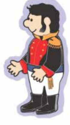
Antonio López de Santa Anna

Sus órdenes causaban molestia en la sociedad, un día ordenó cobrar impuestos por cada ventana que tuviera una casa.