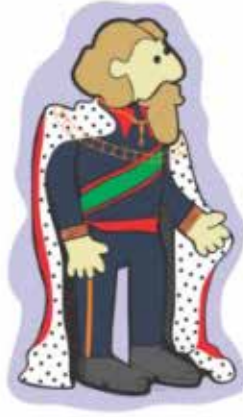
Maximiliano de Habsburgo