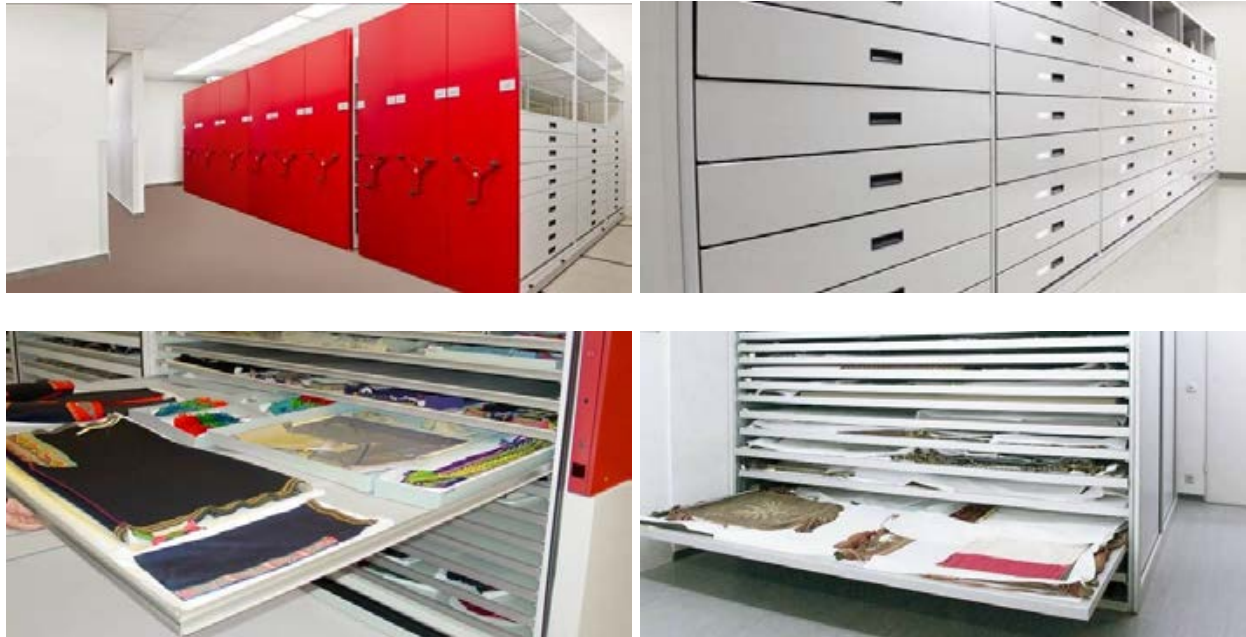
Imágenes ilustrativas de mobiliario requerido

Proyecto que contempla equipar la bóveda con un sistema de almacenaje de alta densidad especializado para resguardo de colección de obra de arte, que incluya estantería, paneles, accesorios, carros, mecanismos, manivelas, rieles y sub-rieles, ello, con la finalidad de salvaguardar las colecciones del patrimonio cultural del País que se resguardan en la Bóveda de MUNE.