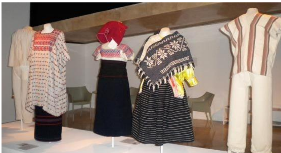
Muestra de colección a resguardar

El recubrimiento con pintura epóxica de este sistema de almacenamiento permite un uso rudo soportando cambios de temperatura y humedad, control de estática y resistencia a la corrosión.