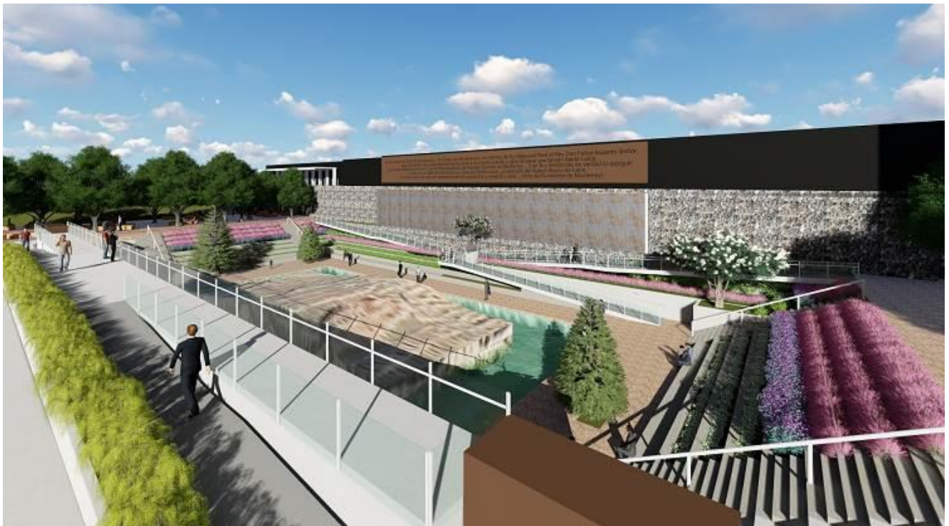
Proyecto de Rehabilitación de Explanada del Museo de Historia Mexicana, segunda etapa (Perspectiva digital)