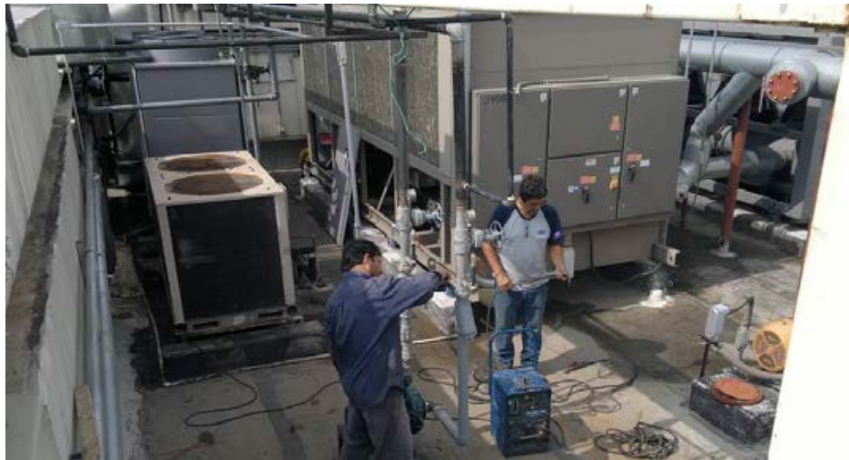
Reparaciones a equipos del aire acondicionado del Museo de Historia Mexicana

Para poder mantener condiciones razonables es indispensable la renovación de equipo de aire acondicionado para diversas áreas del Museo de Historia Mexicana, Museo del Palacio y Museo del Noreste.