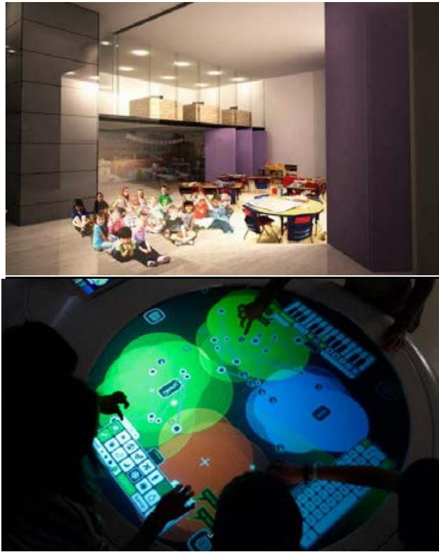
Imágenes ilustrativas de propuestas de equipamiento para el espacio de Servicios Educativos

En el 2012 gracias a la inversión de un recurso Federal fue posible reubicar y acondicionar el área de los Servicios Educativos en la Planta Baja del Museo de Historia Mexicana, integrando todos los servicios en un solo nivel; sin embargo dentro de la intervención no fue posible considerar el equipamiento para el espacio, donde a la fecha se plantean nuevas formas de trabajo acordes a las generaciones de niños y jóvenes que nos visitan en esta época a través de nuevas tecnologías y equipamiento.