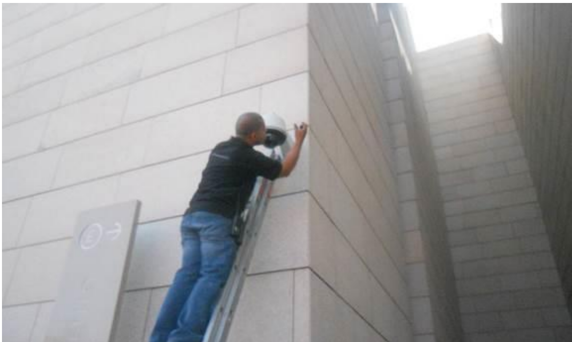
Mantenimiento a equipos de CCTV del Museo del Noreste

En el 2013 el Museo de Historia Mexicana realizó una inversión para la renovación de algunos equipos de circuito cerrado de seguridad del edificio quedando para otra etapa los museos MUNE y MP cuyos sistemas tienen ya una vida de 12 y 13 años respectivamente.