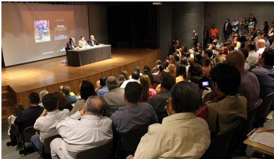
Evento en auditorio del Museo de Historia Mexicana

Una gran cantidad de dichas actividades se realizan a lo largo del año en las instalaciones del auditorio del Museo de Historia Mexicana el cual cuenta con una capacidad para 170 personas, cuenta con foro, telón, equipo de audio y video, y aislamiento acústico. Sin embargo, después de 25 años de actividades continuas y dado el aforo que promueven los eventos organizados por la institución, el equipamiento técnico ha quedado obsoleto y resulta insuficiente para la cantidad de actividades a realizar en el año.