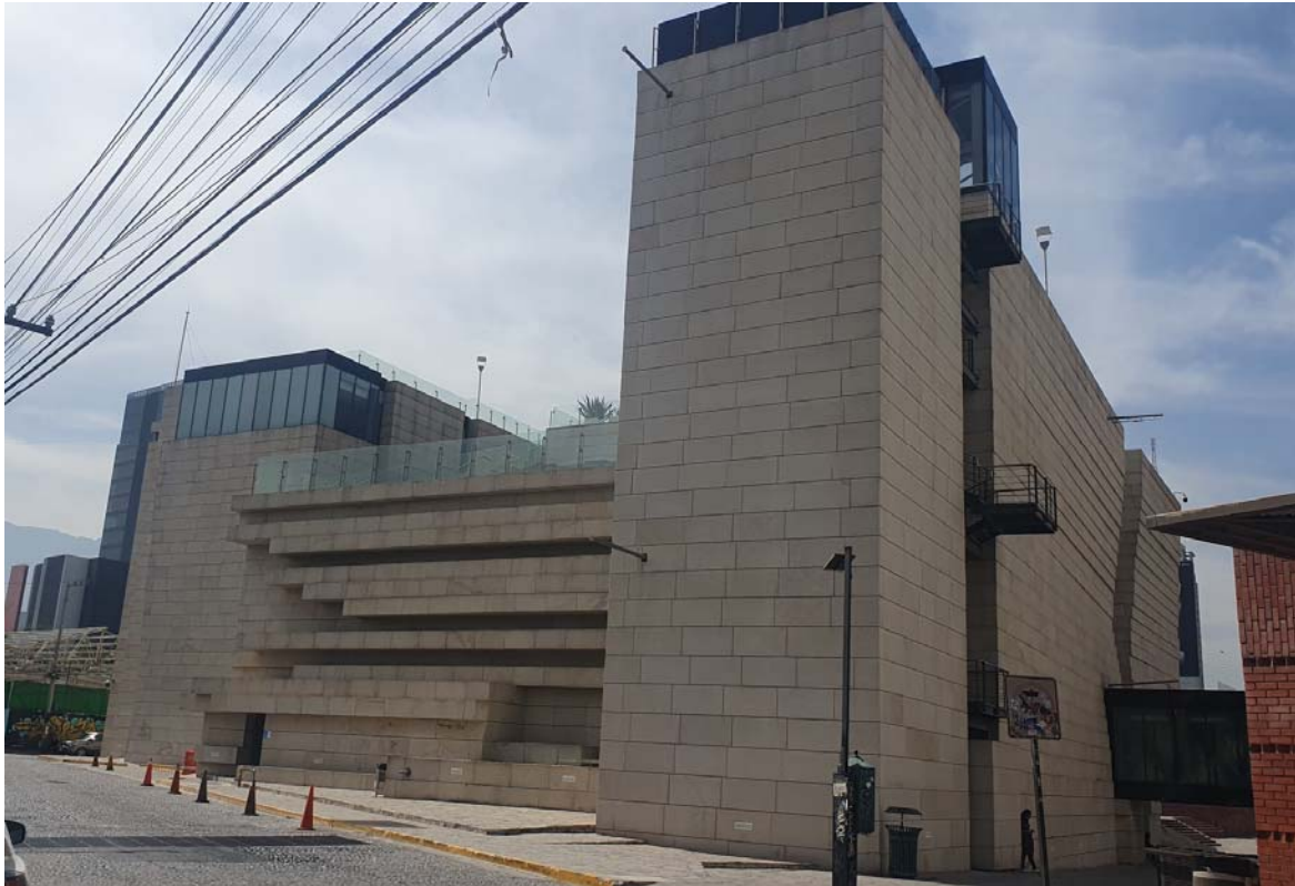
Imagen fachada oriente Museo del Noreste