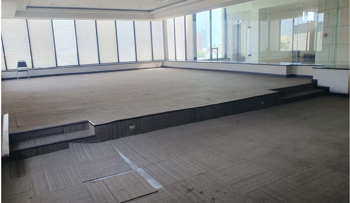
Estado actual en piso de salón MUNE.